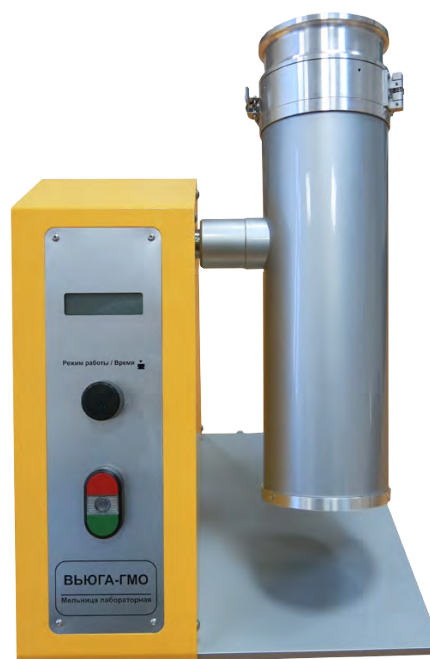
Рис. 4. Положение размольного узла при размоле проб (рабочее положение)

При выборе режима «подсолнечник» процесс измельчения осуществляется в два этапа: