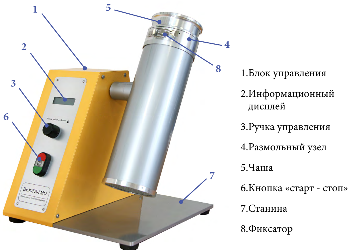
Рис. 1 - Общий вид мельницы