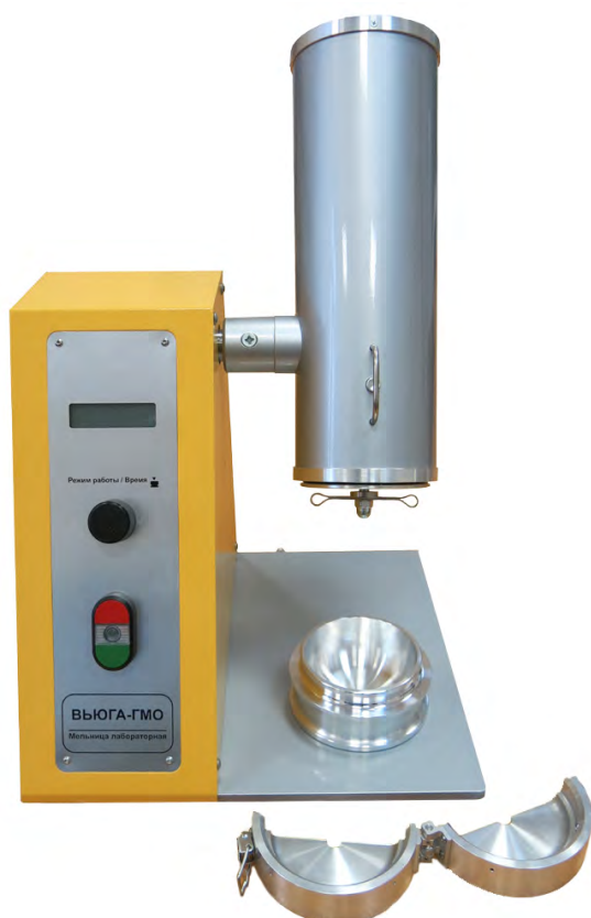
Рис. 3. Положение размольного узла при загрузке и выгрузке проб